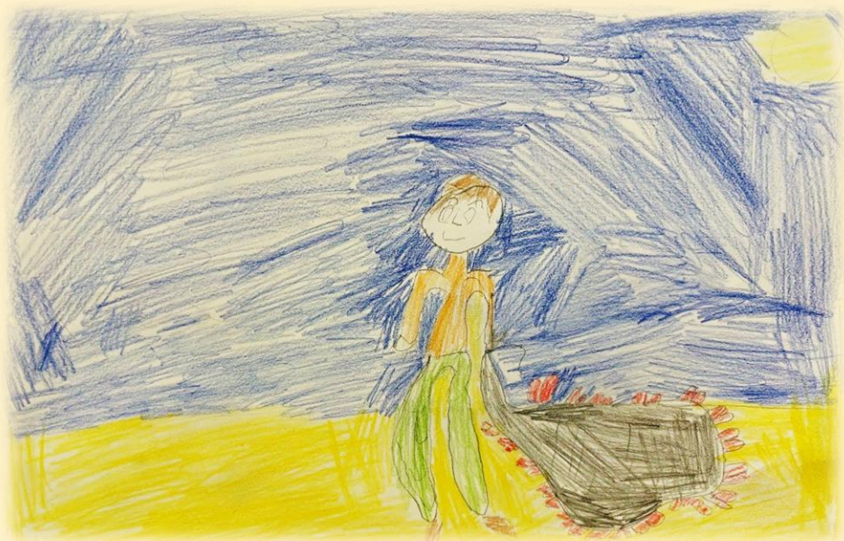
«Иван вернулся домой» Семен К., 12 лет

Вернулся Иван домой, и стал жить счастливо, рыбу ловить и людей добрым словом радовать.