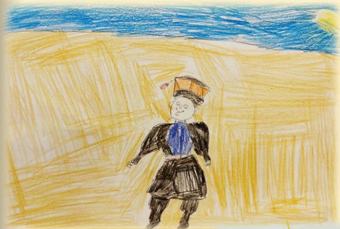
«Басан» Семен К., 12 лет

Жил в степи мальчик по имени Басан. У него был верблюд – большой и сильный. Басан очень любил своего верблюда.